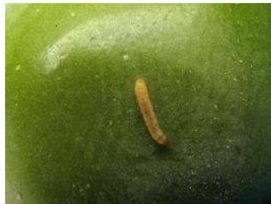
זחל של המזיק