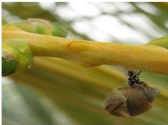
נזק שנגרם מעש התמר הקטן

עש התמר הקטן (בטרחדרה) הוא מזיק ייחודי לתמר, הניזון מפרחים ומפירות תמר שלא הגיעו לבשלות. תעופת הזכרים בערבה מתחילה לרוב בין אמצע חודש פברואר לתחילת מרס, וכשלושה עד ארבעה שבועות אחר כך כבר ניתן לזהות זחלים באשכולות. עד חודש יולי מקים העש שלושה-ארבעה דורות חופפים, ולאחר מכן נפסקת פעילותו עד האביב הבא. משך דור (מביצה לביצה) הוא כחודש ימים. הזחל חי כשבועיים, שבמהלכם הוא ניזון מהתפרחות ומהפרי וגורם לנשירתם. אוכלוסייה גדולה של העש עלולה להסב נזק כלכלי חמור, עד כדי אובדן חלק גדול מהיבול. הנזק נגרם בעיקר מחדירת הזחל לפרי באזור עלי הגביע, שאותה ניתן לזהות לפי הפרשת הגללים והקורים. לפני כניסתו לפרי, הזחל טווה עליו או בסנסן קורים דביקים. פרי שניזוק לרוב נושר או שנותר תלוי על הסנסן.