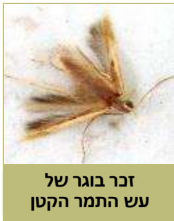
זכר בוגר של עש התמר הקטן

עש התמר הקטן (בטרחדרה) הוא מזיק ייחודי לתמר, הניזון מפרחים ומפירות תמר שלא הגיעו לבשלות. תעופת הזכרים בערבה מתחילה לרוב בין אמצע חודש פברואר לתחילת מרס, וכשלושה עד ארבעה שבועות אחר כך כבר ניתן לזהות זחלים באשכולות. עד חודש יולי מקים העש שלושה-ארבעה דורות חופפים, ולאחר מכן נפסקת פעילותו עד האביב הבא. משך דור (מביצה לביצה) הוא כחודש ימים. הזחל חי כשבועיים, שבמהלכם הוא ניזון מהתפרחות ומהפרי וגורם לנשירתם. אוכלוסייה גדולה של העש עלולה להסב נזק כלכלי חמור, עד כדי אובדן חלק גדול מהיבול. הנזק נגרם בעיקר מחדירת הזחל לפרי באזור עלי הגביע, שאותה ניתן לזהות לפי הפרשת הגללים והקורים. לפני כניסתו לפרי, הזחל טווה עליו או בסנסן קורים דביקים. פרי שניזוק לרוב נושר או שנותר תלוי על הסנסן.